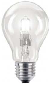
Culot E27 et B22