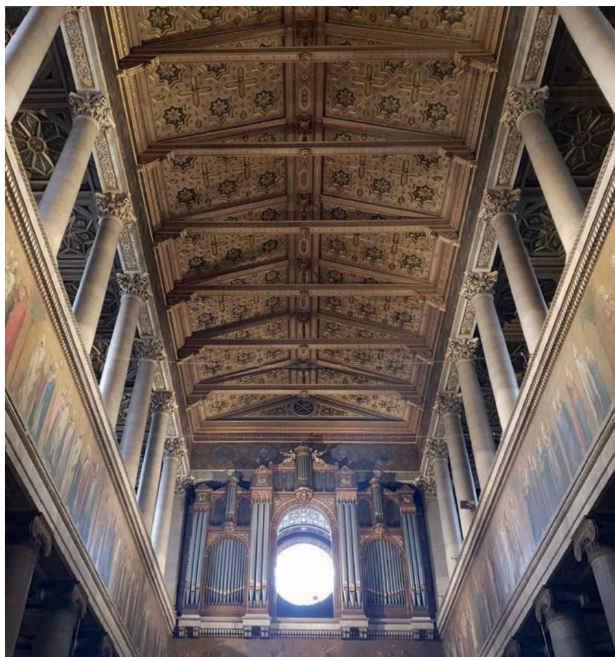
Eglise Saint Vincent de Paul, Paris (France)

Eclairage d'œuvres d'art murales (peintures, photographies, tapisseries, esquisses...)