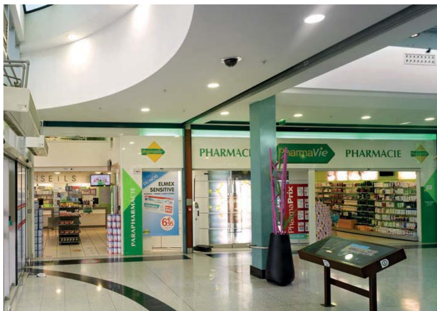
Centre commercial, Quetigny (France)