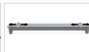
Entraxe des supports de fixation réglable