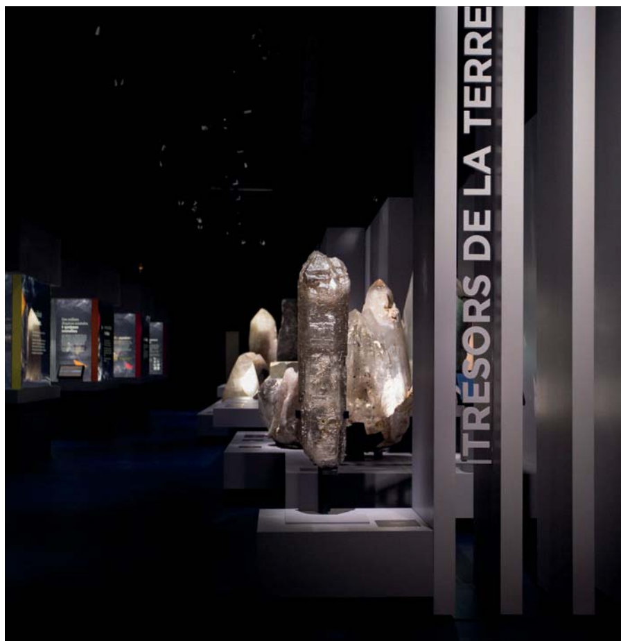
Exposition «Trésors de la Terre» - MNHN, Paris (France) ©Augustin de Valence, Scénographie : MAW

Eclairage d'œuvres d'art, en volume (statues, sculptures,...) ou murales (peintures, photographies,...)