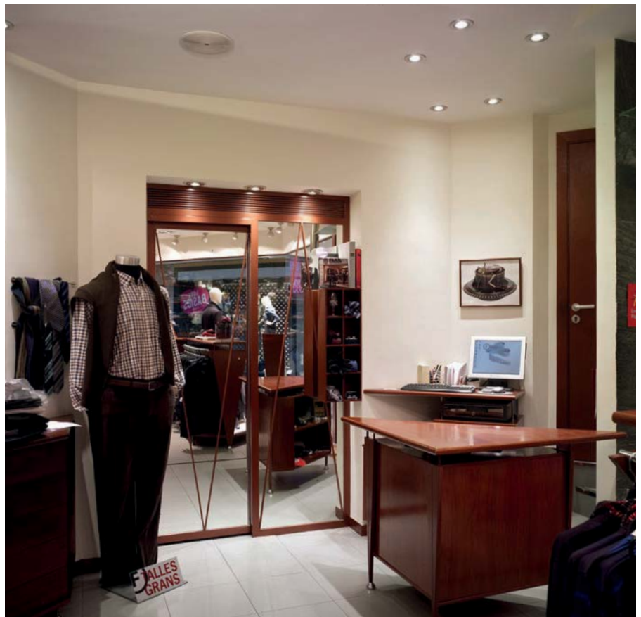
Can Fajol, Figueres (Espagne)