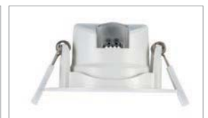
Capot Transparent pour le Blanc Neutre 4000K