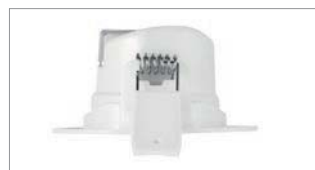
Montage sans outil : connecteurs à poussoir et capot de protection clipsable