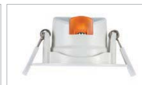
Capot Orange pour le Blanc Chaud 3000K