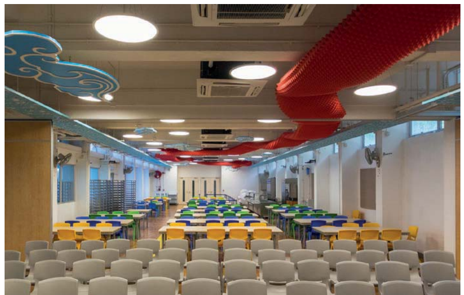
Ecole française internationale «Hung Hom» (Hong Kong)