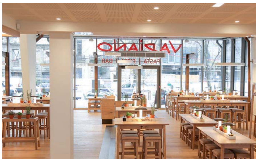
Restaurant Vapiano, Bordeaux (France)