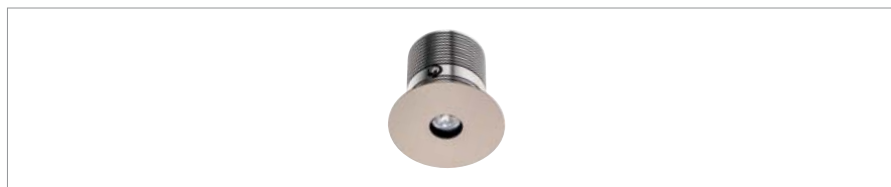
Version TEO EF fixe, sur demande